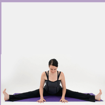
Flexión hacia delante