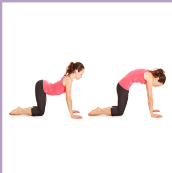
Vaca y Gato