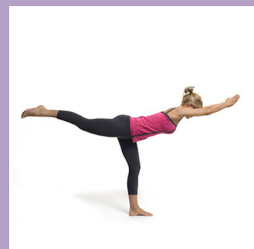
El Guerrero III