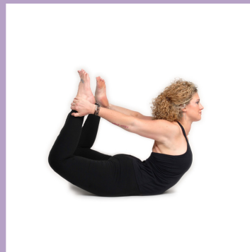
Postura del arco