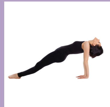
Postura del Sol